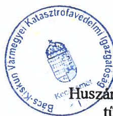
Huszár Tibor t. dandártábornok tűzoltósági főtanácsos katasztrófavédelmi igazgató