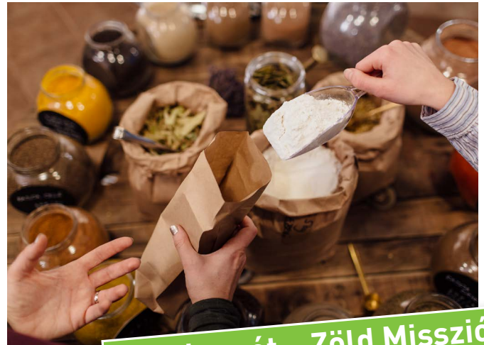
Kecskemét – Zöld Misszió