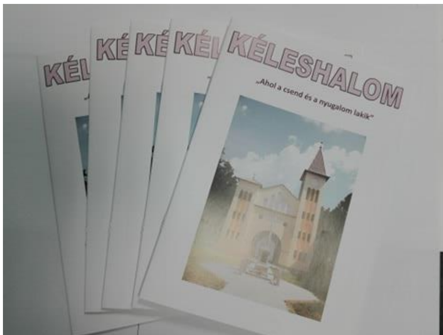
5. kép: A helytörténeti dokumentumok gyűjtése, feltárása keretein belül elkészült kiadvány

A helyi lakosok bevonásával elkészült kiadványnak köszönhetően a helyi identitás megerősítése megtörtént, a lakosság több információval rendelkezik az életteréről és ezzel erősödött a lokális kötődésük.