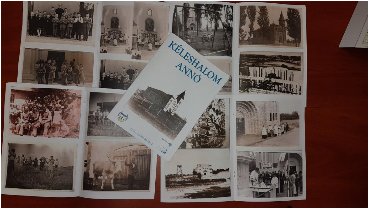
6. kép: A falukönyv, kalendárium tevékenység keretein belül elkészült kiadvány