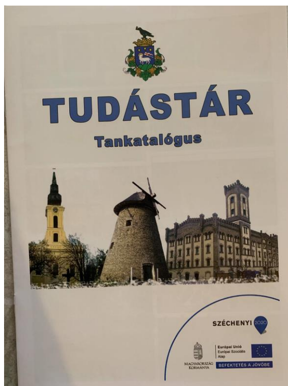
1. kép: A Tankatalógus borítóképe

Helyi értékörzés, értékfeltárás: 2019 nyarán Jánoshalmán elkészült egy újabb kiadvány 500 példányszámban „Jánoshalmi Képeskönyv” címmel. A kiadvány 150 oldalas, fektetett A4-es méretű. A tevékenység célcsoportja a helyi lakosok. Célja, hogy a helyben elérhető kihasználatlan értékeket, helyi tudást dokumentáljuk, rendszerbe foglaljuk és nyilvánosságra hozzuk, annak érdekében, hogy a helyi gazdaságfejlesztés ennek a tudásnak a birtokában szerveződjön. A helyi identitás fontos részét képezi, hogy a közösség tagjai részt vegyenek a helyi értékek bemutatásában, valamint tisztában legyenek azokkal. Jánoshalma életében fontos volt, hogy a település területén fellelhető nemzeti értékeket tartalmazó gyűjtemény jöhessen lére. Ezt a célkitűzést az elkészült fotókönyvvel, mely több, mint 150 képet tartalmaz sikerült elérni. A tevékenység során a megbízott személy felvette a kapcsolatot a lakossággal, a feltárt értékeket összegyűjtötte és rendszerezte. A fotókon szereplő személyektől hozzájárulást szerzett a kiadványban való megjelenítéshez. Az így összegyűjtött és megszerkesztett anyagot eljuttatta a legjobb ajánlatot adó nyomdának, mely a nyomdai munkálatokat elvégezte. Így létrejött kiadvány magas kulturális értékkel bír, mely tartalmazza a helyi értékekről készült fotókat. Dokumentálja az utókor számára is a település értékeit.