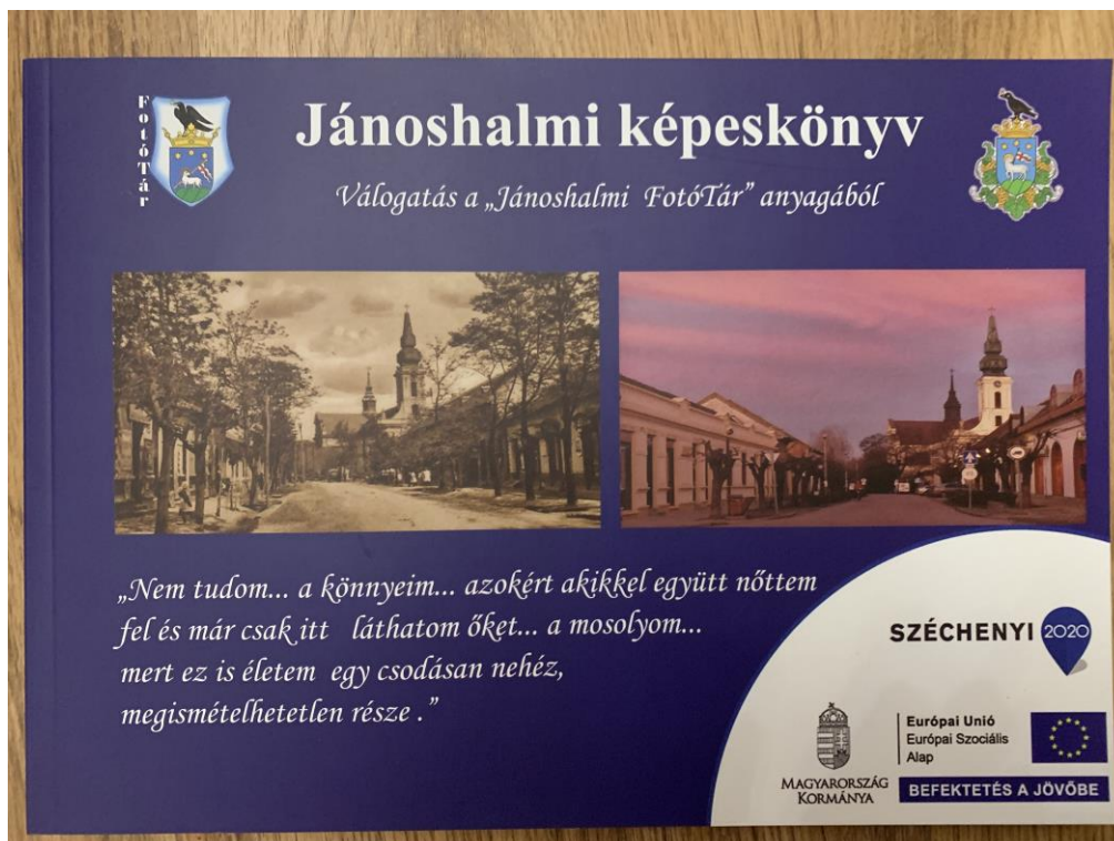
2. kép: Helyi értékörzés, értékfeltárás keretében elkészült fotókönyv

Szellemi kulturális örökség feltárása: A teljes projekt utolsó elemként 2021. decemberében elkészült Jánoshalma harmadik kiadványa „Jánoshalma szellemi, kulturális értékei” címmel, 500 példányszámban, 120 oldal terjedelemmel, B5-ös méretben. A tevékenység célcsoportja a helyi lakosok. Célja, a helyi kulturális örökség megismertetése a helyi lakosokkal. A kiadvány készítésében 7 szakember vett részt, két fő fotós és 5 fő szerkesztő. A tevékenység során kutató, kulturális szakemberek felkutatták, feltárták és dokumentálták, és ezen keresztül mindenki számára hozzáférhetővé tették a helyi kulturális örökséget. A kiadvány elkészítéséhez összeállt csapat tagjai közül a fotósok feladata volt, hogy a szerkesztők által készített cikkekhez fényképeket készítsenek, valamint a meglévő fénykép archívumokból fotókat gyűjtsenek az adott témakörökhöz. A szerkesztők pedig felkutatták és meghatározták a kiadványban szereplő témákat, elvégezték a kutatómunkát és az információgyűjtést. Az összehangolt több hónapon át tartó csapatmunka eredményeként létre jött kiadvány hozzájárul a helyi identitás megerősítéséhez, a múlt és helyi értékek ismertetéséhez. Ezáltal a lakosság több információval rendelkezik az életteréről és erősödött a lokális kötődése a település iránt. A cselekvési tervben meghatározott célkitűzés elérésre került.