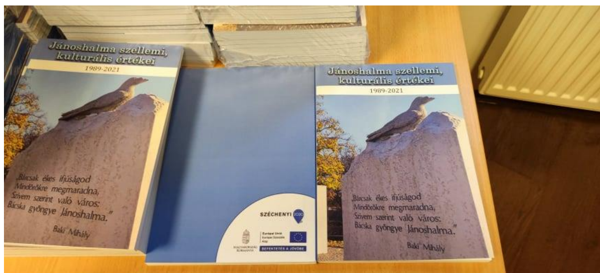
3. kép: A szellemi kulturális örökség feltárása keretein belül elkészült kiadvány