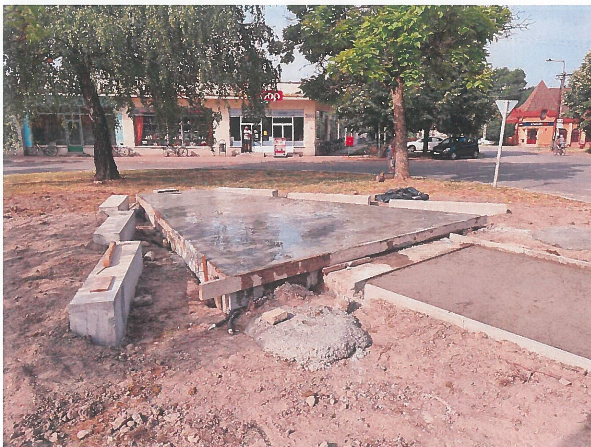
Az elkészült betonalap 2021 július végén

Az emlékmű alapjait egy helyi építőipari cég készítette el idén júliusban. Amint sikerül előteremtteni a teljes anyagi forrást, megkezdődhet a szoborcsoport elkészítésének munkálatai is. Az előzetes tervek és várakozások alapján az emlékmű 2021 ősz végére készülhet el teljesen.